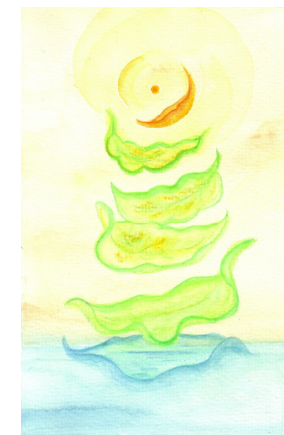
Logo, Lone Segerlin: "Integration"

Da man ikke kan blive henvist på den samme hændelse 2 gange gælder det om at få mest muligt ud af det.